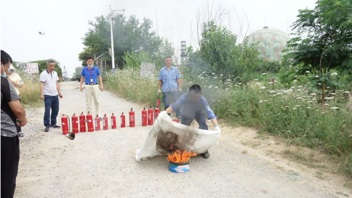
1) 灭火毯灭火实战演练。