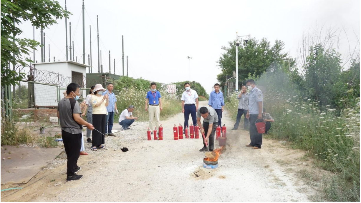
3) 消防砂灭火实战演练。