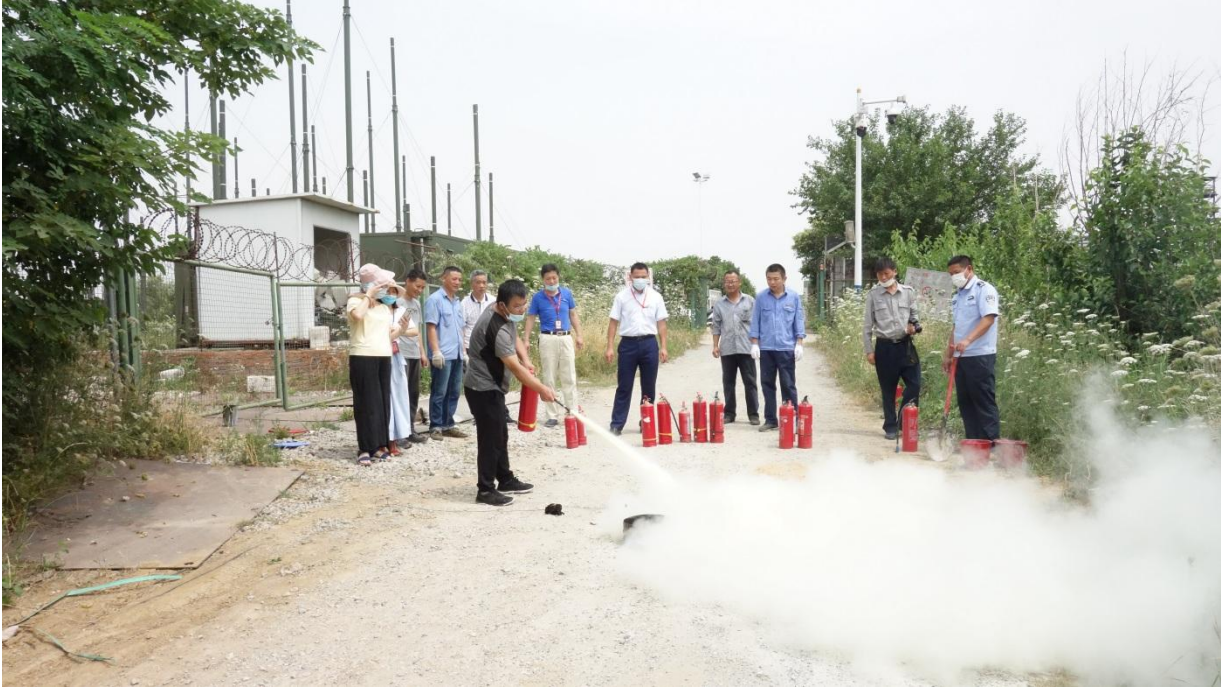
2) 灭火器灭火实战演练。